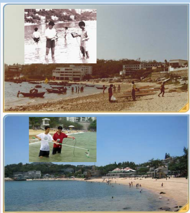
赤柱正滩1980年代初（上图）与2008年（下图）外貌的比较。 插图为当时的泳滩水质监测队